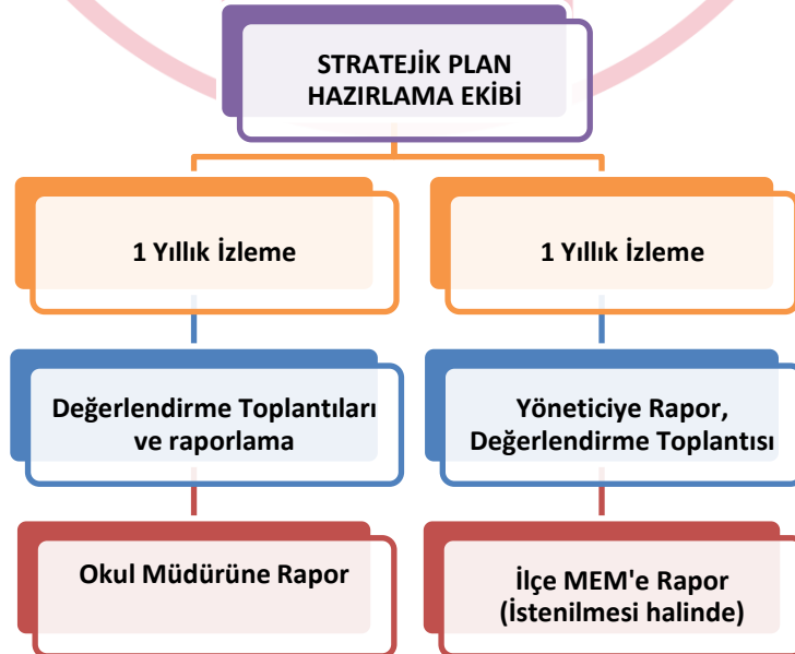
Şekil 2 İzleme ve Değerlendirme Süreci

Müdürlüğümüzün 2019-2023 Stratejik Planı İzleme ve Değerlendirme sürecini ifade eden İzleme ve Değerlendirme Modeli hazırlanmıştır. Okulumuzun Stratejik Plan İzleme-Değerlendirme çalışmaları eğitim-öğretim yılı çalışma takvimi de dikkate alınarak 1 eğitim öğretim yılı süresince, eğitim öğretim yılı başında ve sonunda yapılan seminer dönemleri ile öğretmenler kurullarında değerlendirmeler gerçekleştirilecektir. Bu dönemlerde Okul Müdürüne rapor hazırlanacak ve değerlendirme toplantısı düzenlenecektir. İzleme-değerlendirme raporu, istenildiğinde İlçe Milli Eğitim Müdürlüğüne gönderilecektir.